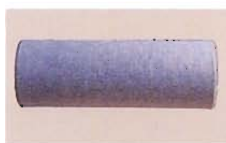
■繊維状圧縮抗菌活性炭