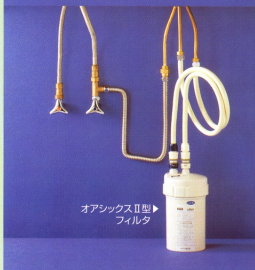
オアシックスⅡ型 フィルタ