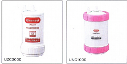
オプション金・機器も取付費用別A04H（UZC2000用） 6,500円（税込）6,825円（税込）

※別カタログ記載の仕様・価格は、予告なく変更する場合がございます。ご了承ください。 ※別カタログ記載の製品写真は、色合いのため実際の色とは多少異なります。