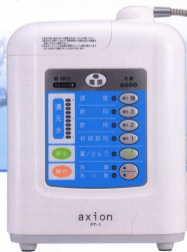
水道直結連続生成型電解還元水浄水器